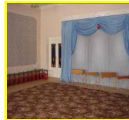
Музыкальный зал (№14)