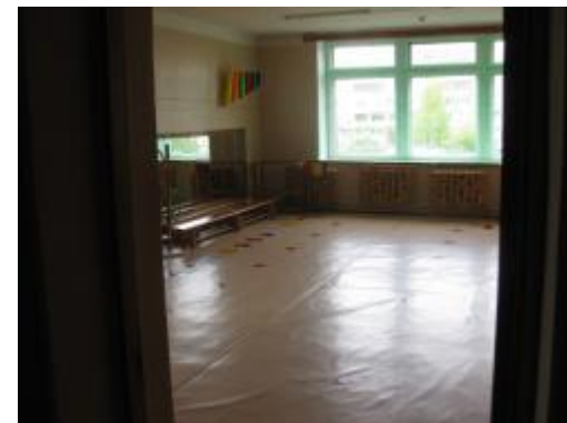
Физкультурный зал (№11)