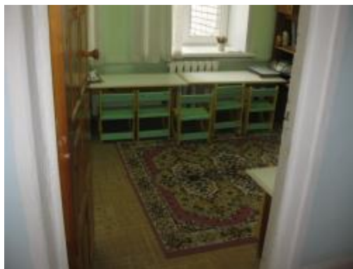
Кабинет педагога- психолога (№10)