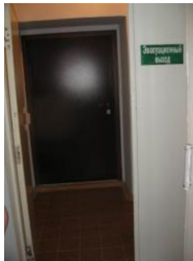
Эвакуационный выход (№6)