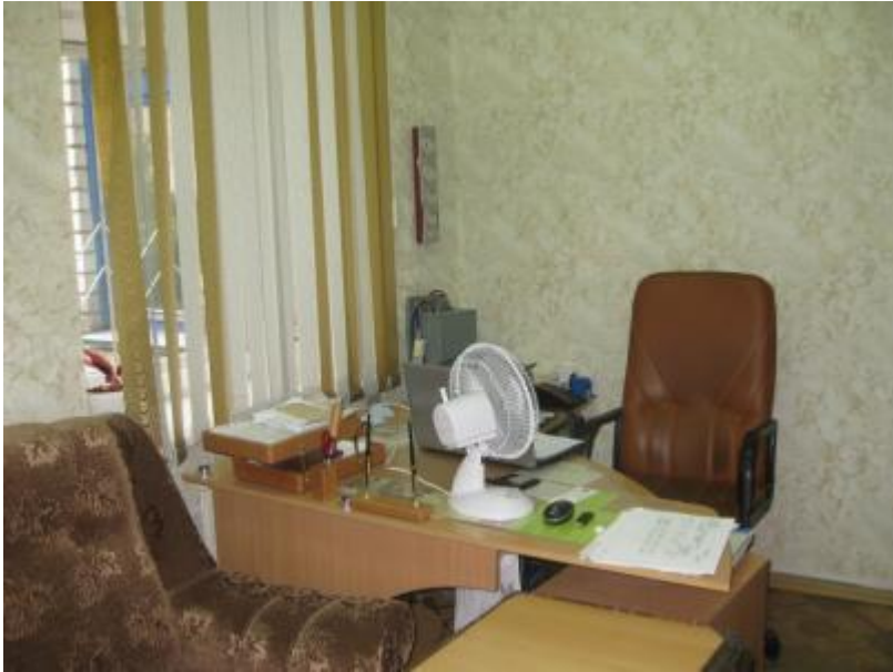
Кабинет заведующей (№7)