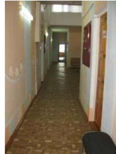
Коридор второго этажа (№5)