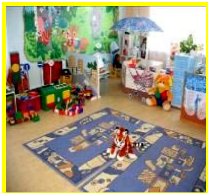
Группа ДОУ (№ 12)