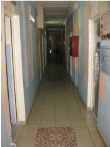
Коридор первого этажа (№4)