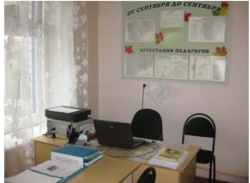
Методический кабинет (№8)