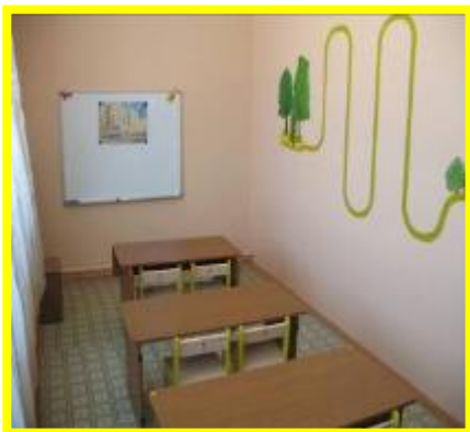
Кабинет тифлопедагога (№9)